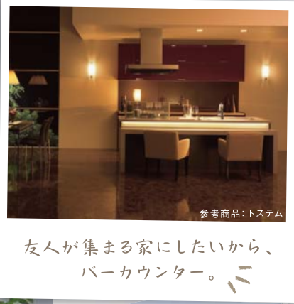
参考商品: トステム