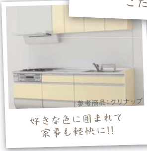
参考商品: クリナップ