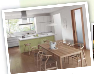
Island Kitchen たとえば、アイランドキッチン

キッチンが変わると、日常が変わる。 家族にやさしく心地よい、新しいキッチンのスタイル。