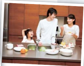
家族揃ってキッチンに立つこともOK。