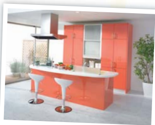
Color Coordinate たとえば、カラーコーディネート