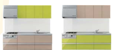
※写真はカラーコーディネートの一例です。